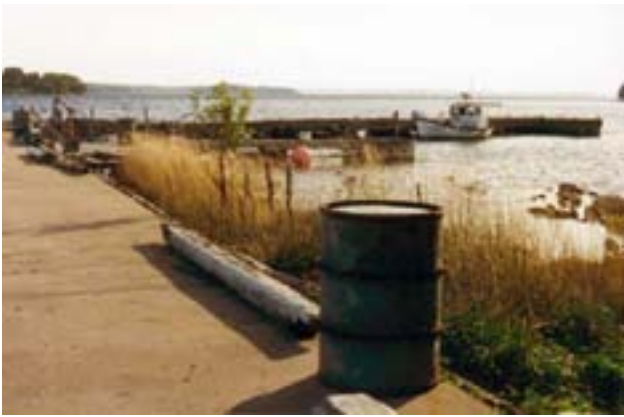
Hamnpiren vid Ängholmem

För ängholmskolonins räkning lät Rågöstiftelsen uppföra en hamnpir i betong längst ut på Ängholmsudden. Den skulle användas av de estlandssvenska fiskarna.