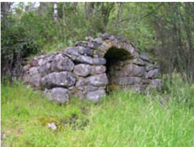
Källaren vid Svedholms stuga (se sidan 5) är varaktigt övergiven, alltså ett fornminne.

Riksantikvarieämbetet i Stockholm (nyligen föreslaget att flyttas till Visby) registrerar fornminnen i ett fornminnesregister. Det består av två delar: dels ekonomiska kartor med varje känd fornlämning markerad, dels en beskrivning av lämningen. Registret innehåller i dag ca 400 000 fornminnesplatser. Den som vill veta mer om fornminnen och andra kulturminnen kan med fördel söka upp Riksantikvarieämbetets hemsida www.raa.se