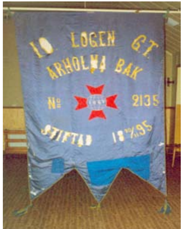
Standaret som "Västerbottens Pärla" skänkte till logen "Arholma Båk" på Björkö