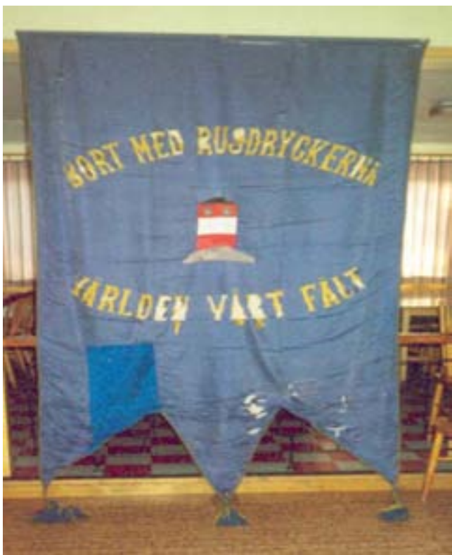
Standaret som "Arholma Båk" köpte 1915

arbete ledde till att logen den 6 mars 1915 kunde inköpa ett standar från Liljegrens Flaggfabrik i Norrköping för 200 kr. Standaret, som fortfarande är mycket vackert, förvaras i Norrtälje stadsarkiv.