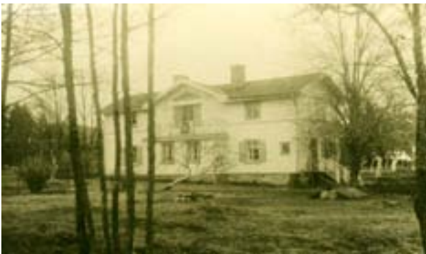
Norrgården (Prästgården) 1931