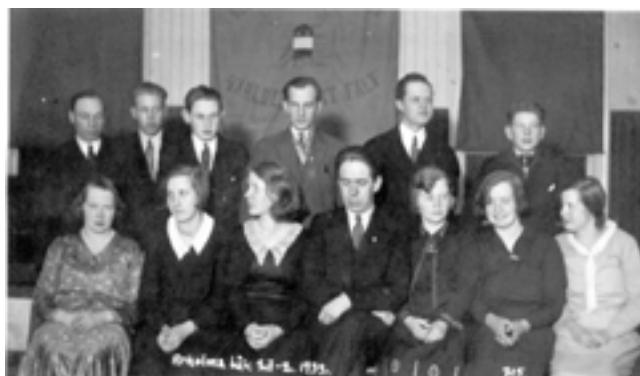
Teatergrupp modell 1932.

tidigare ett kärr, som man ser resterna av på andra sidan vägen. Från Sundbergs grusgrop i Västra Edsvik kördes ett otal gruslass till lokalen som fyllning, i dag täckt av en asfaltplatta.